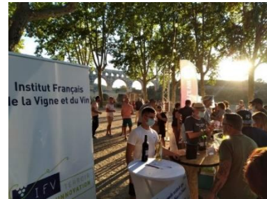
Dégustation IFV Pont du Gard