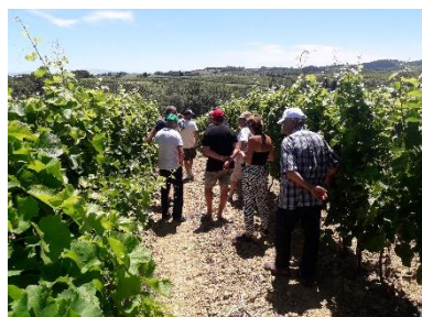
Domaine de Cazes 2020