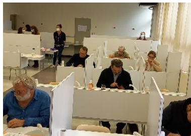
Plateau sensoriel – INRAé- Supagro