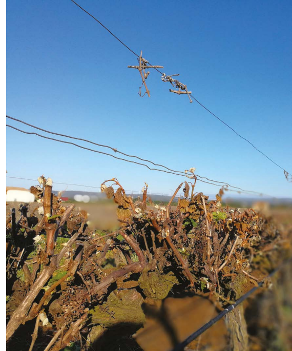
Dégât de gel sur vigne

(1) Rapport du Député Frédéric Decrozaille sur la gestion des risques en agriculture publié le 22 avril 2021