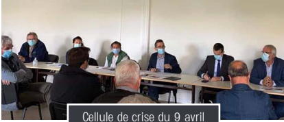
Cellule de crise du 9 avril