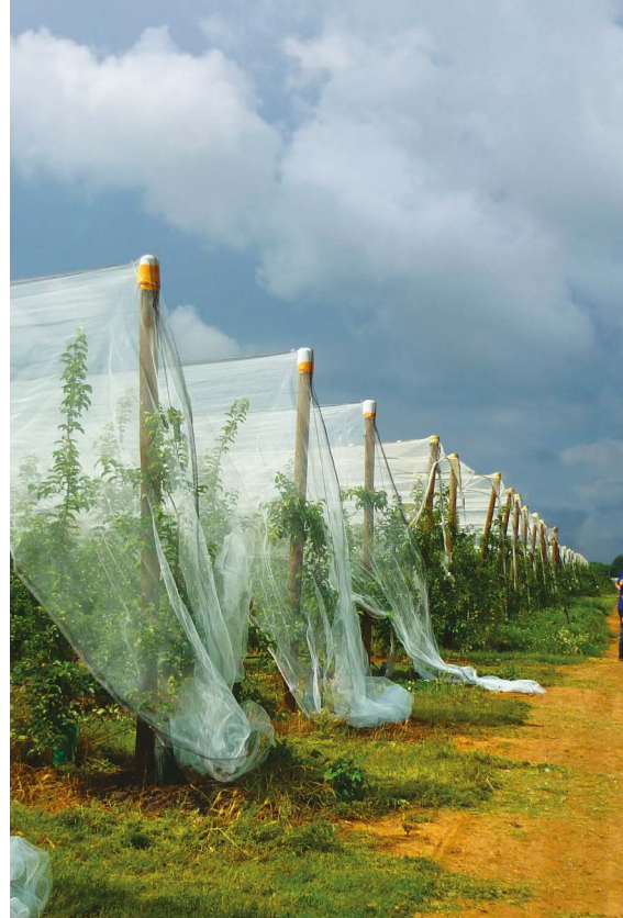
Filets de protection