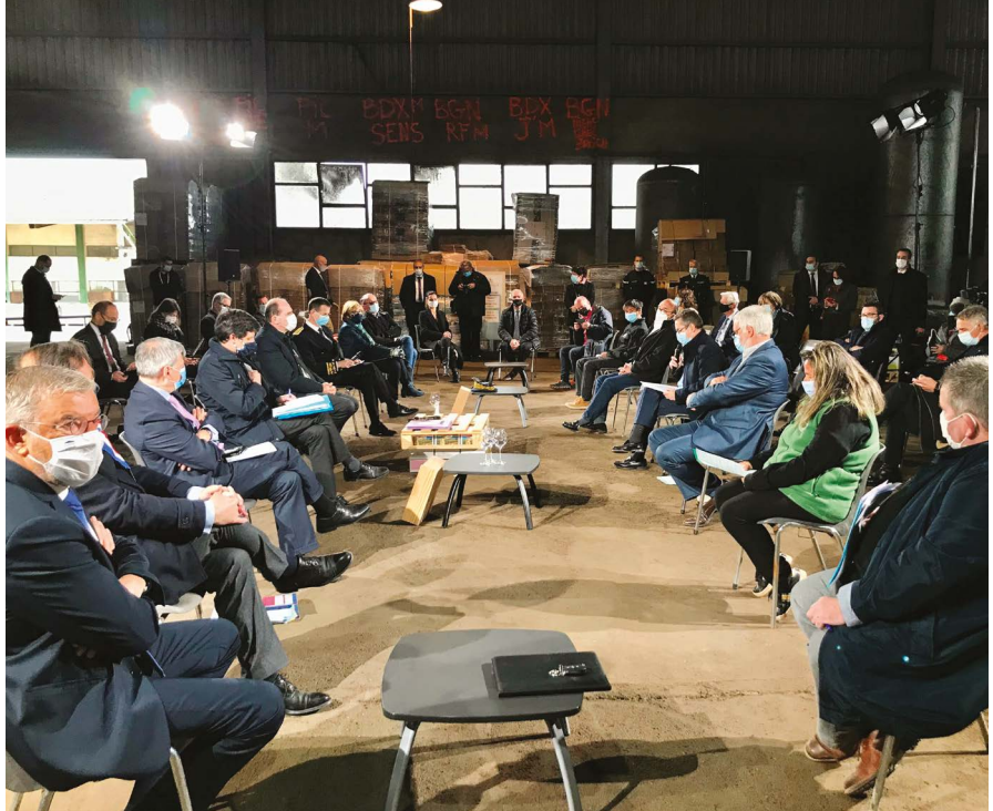
Réunion de travail le 17 avril à la cave de Montagnac avec le 1er Ministre et le Ministre de l'agriculture