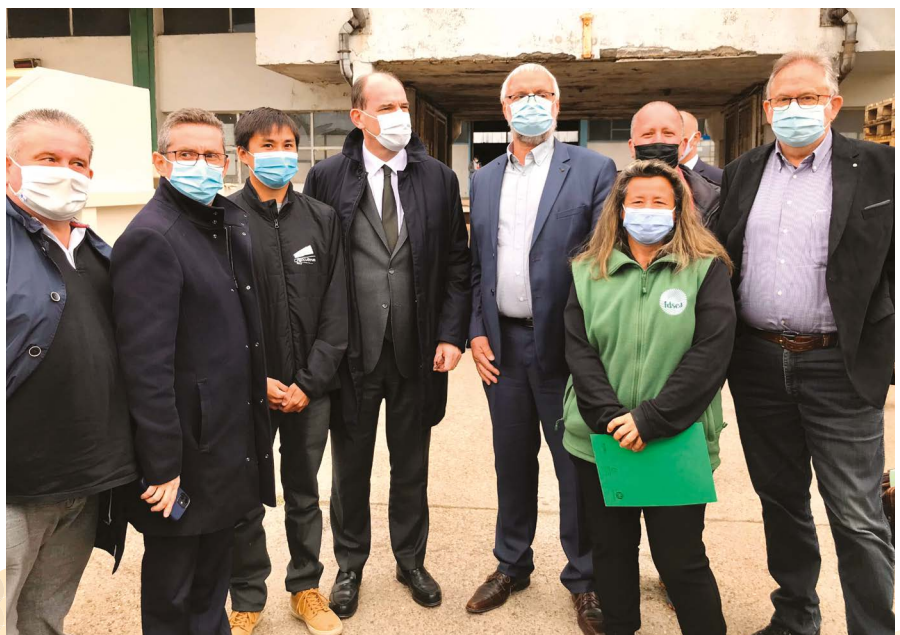
Le 1er Ministre avec la profession agricole – Cave de Montagnac

“DOUBLEMENT DE L'ENVELOPPE DE 100 M€ À 200 M€ DU PLAN DE RELANCE GESTION DES RISQUES”