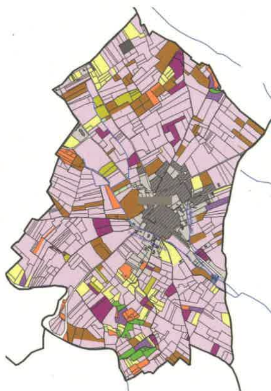
Exemple de carte d'occupation des sols

"Pour visualiser le devenir de l'agriculture et favoriser la réflexion, pour l'aménagement de votre territoire"